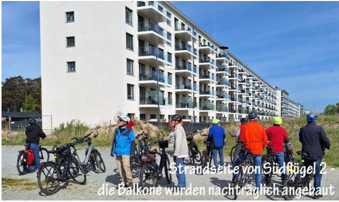
Strandseite von Südflügel 2 - die Balkone wurden nachträglich angebaut