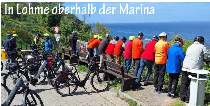
In Lohme oberhalb der Marina