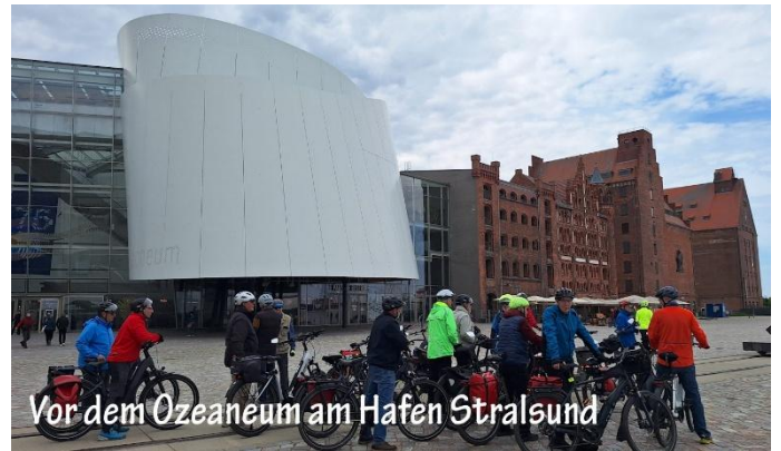
Vor dem Ozeaneum am Hafen Stralsund