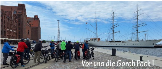
Vor uns die Gorch Fock I