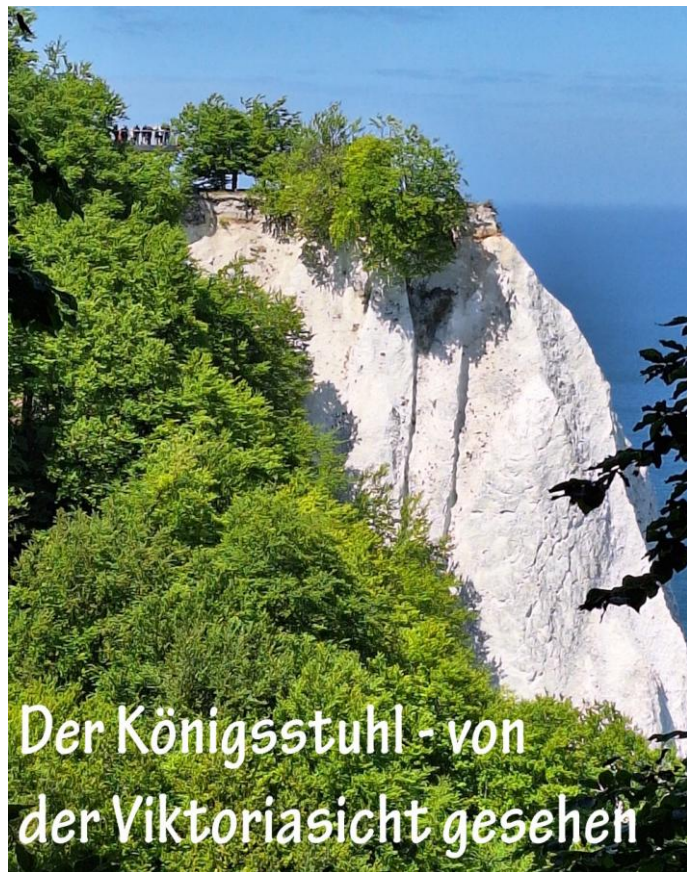
Der Königsstuhl - von der Viktoriasicht gesehen