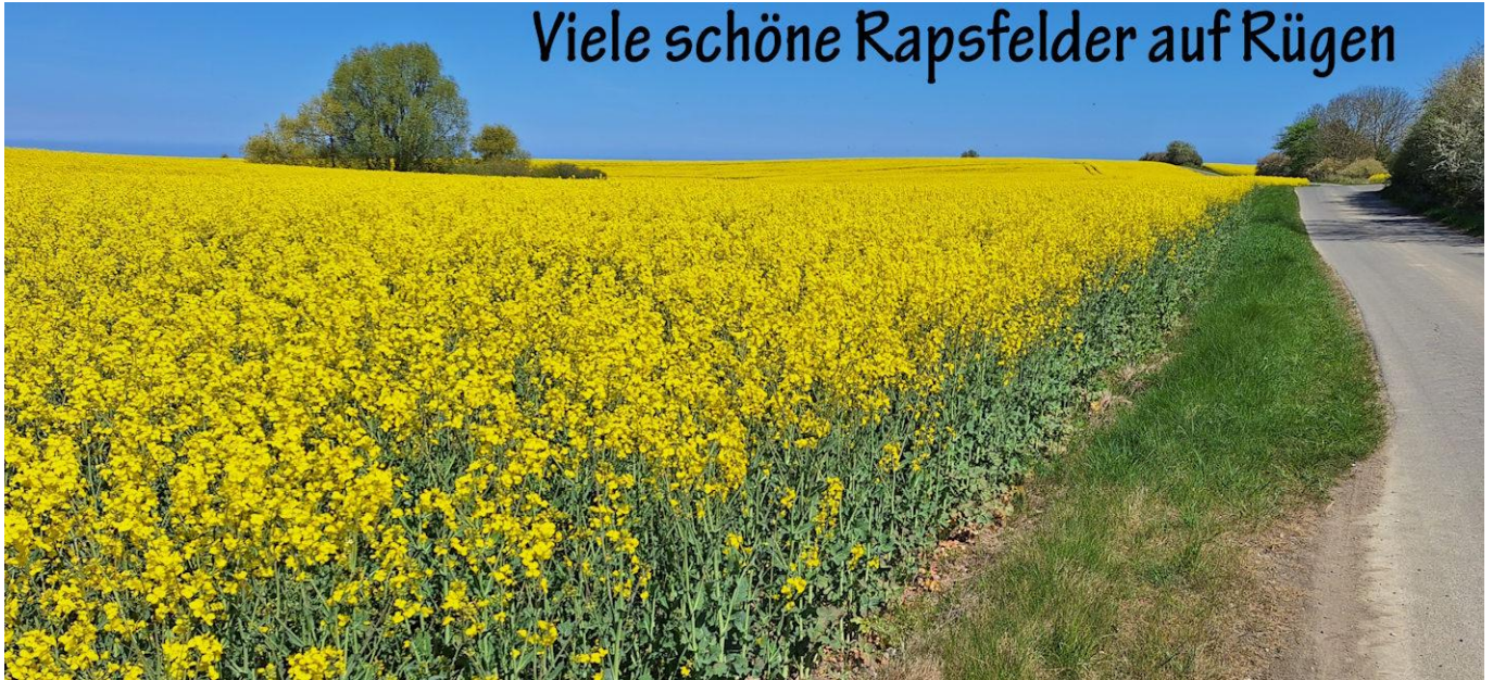
Viele schöne Rapsfelder auf Rügen