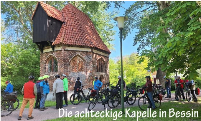
Die achteckige Kapelle in Bessin