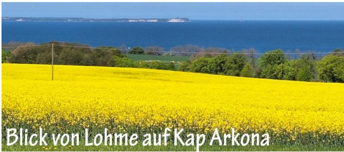
Blick von Lohme auf Kap Arkona