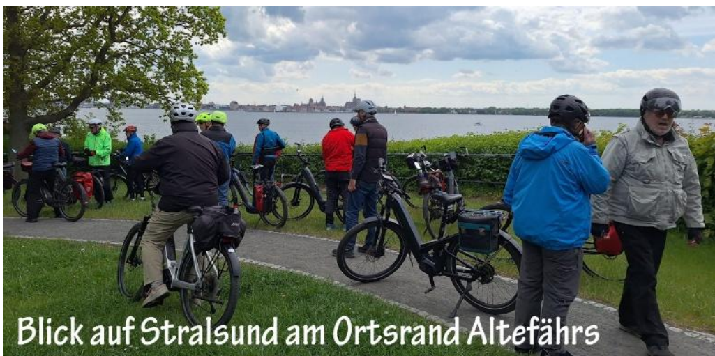
Blick auf Stralsund am Ortsrand Altefährs