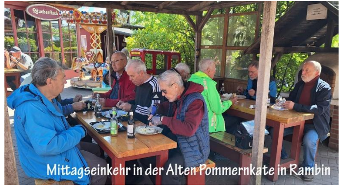
Mittagseinkehr in der Alten Pommernkate in Ramin