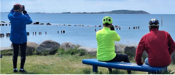
In Dranske - Blick auf Hiddensee