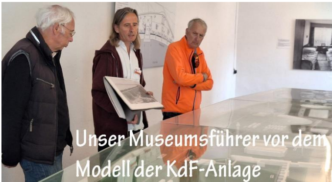
Unser Museumsführer vor dem Modell der KdF-Anlage